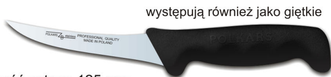
Nr 17 Długość ostrza: 125 mm

Zdjęcie przedstawia nóż z rękojeścią czarną.